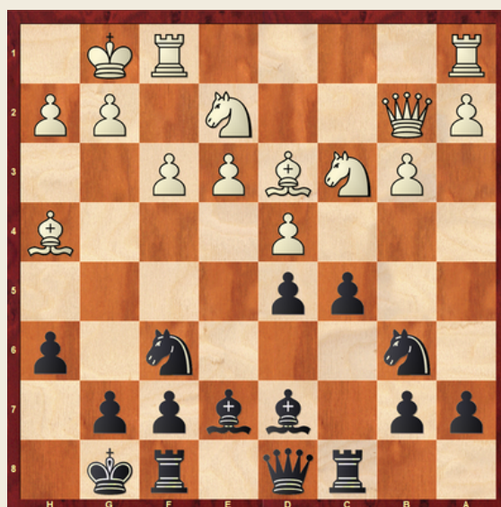
Diagram 1: Beli na potezi zmagata!